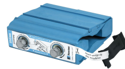
Unitate de compresie Wedge și setul Wedgekit

Pentru mai multe informații, vă rugăm să vizitați roxtec.com .